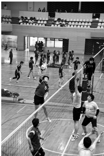
第42回北区春季バレーボール 男女別オープン大会