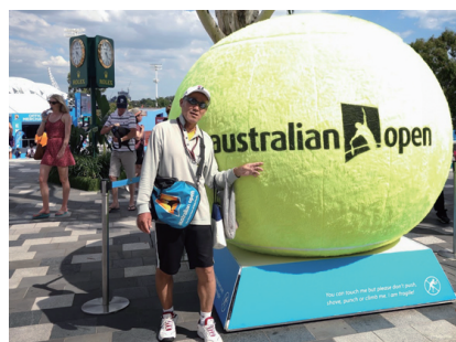
全豪オープンのツアーに協賛