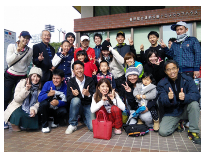
毎年、全国大会に愛知県代表を送り出している(2015年の全国大会にて)