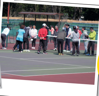
2017年から 新しくできた ←Kグループ→